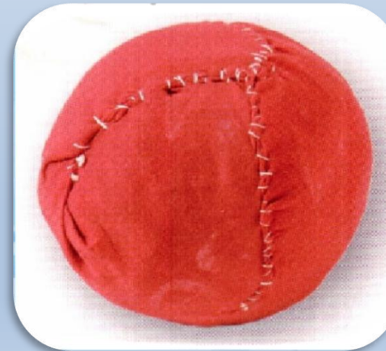
МЯЧ ИЗ ТКАНИ