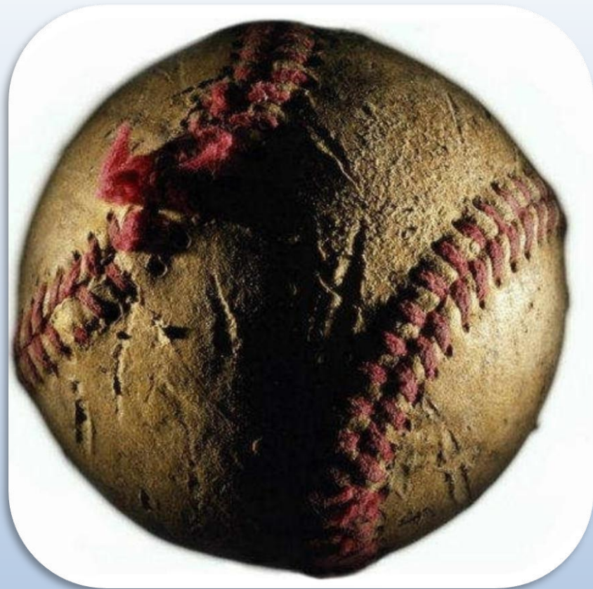
МЯЧ ИЗ КОЖИ, НАБИТЫЙ ТРАВОЙ И ОПИЛКАМИ