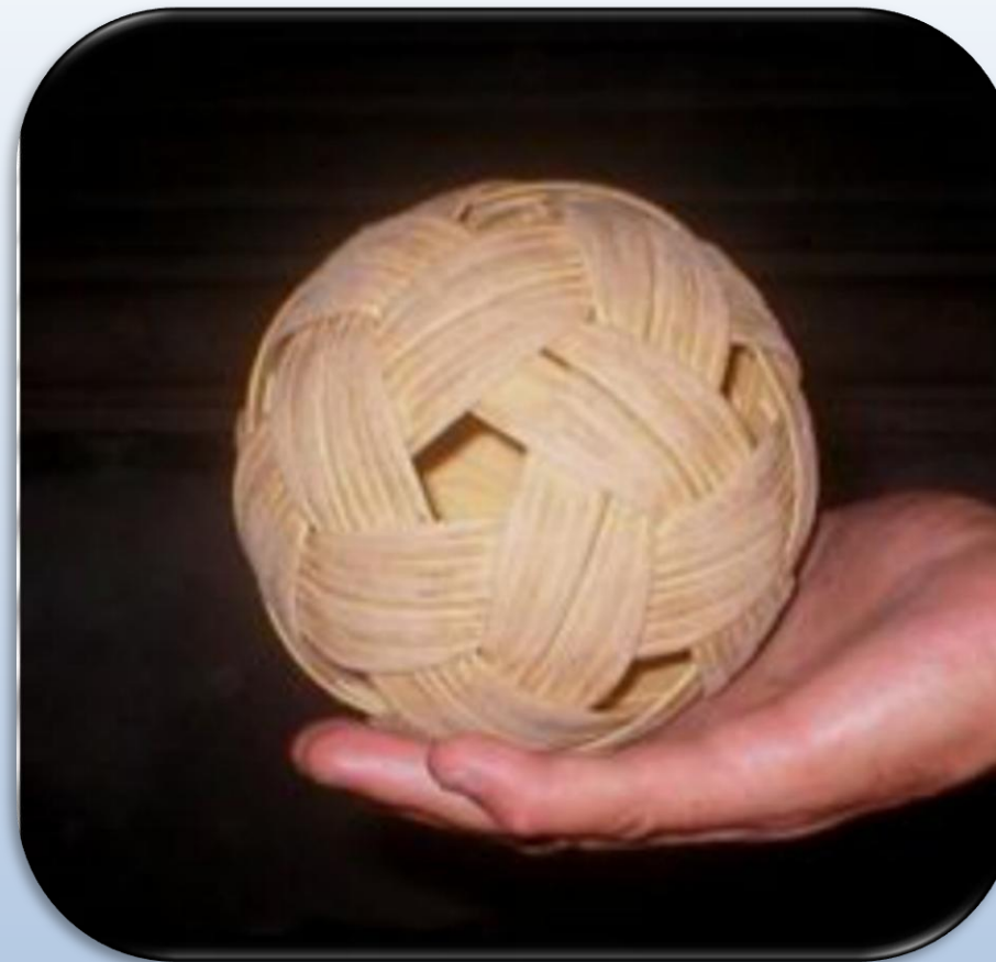
МЯЧ ИЗ ТРОСТНИКА