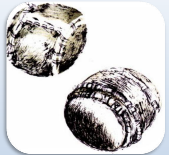
МЯЧ ИЗ БЕРЕСТЫ

В России мячи были разные. В раскопках под Новгородом нашли мячи разных размеров, сшитые из кожи. Ими играли дети в XIII веке. Крестьянские дети прошлого века играли легкими мячиками из бересты или тяжелыми мячами, туго свернутыми из тряпок