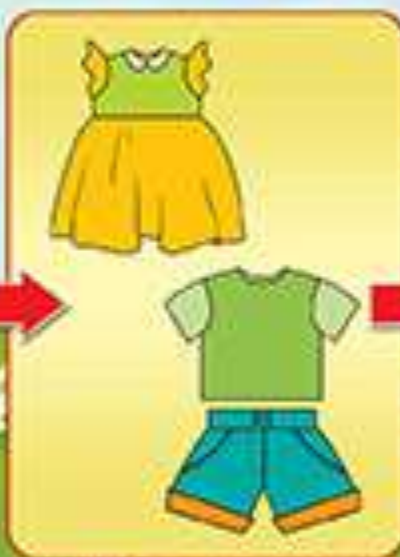
МАЙКА+ШОРТЫ или ПЛАТЬЕ